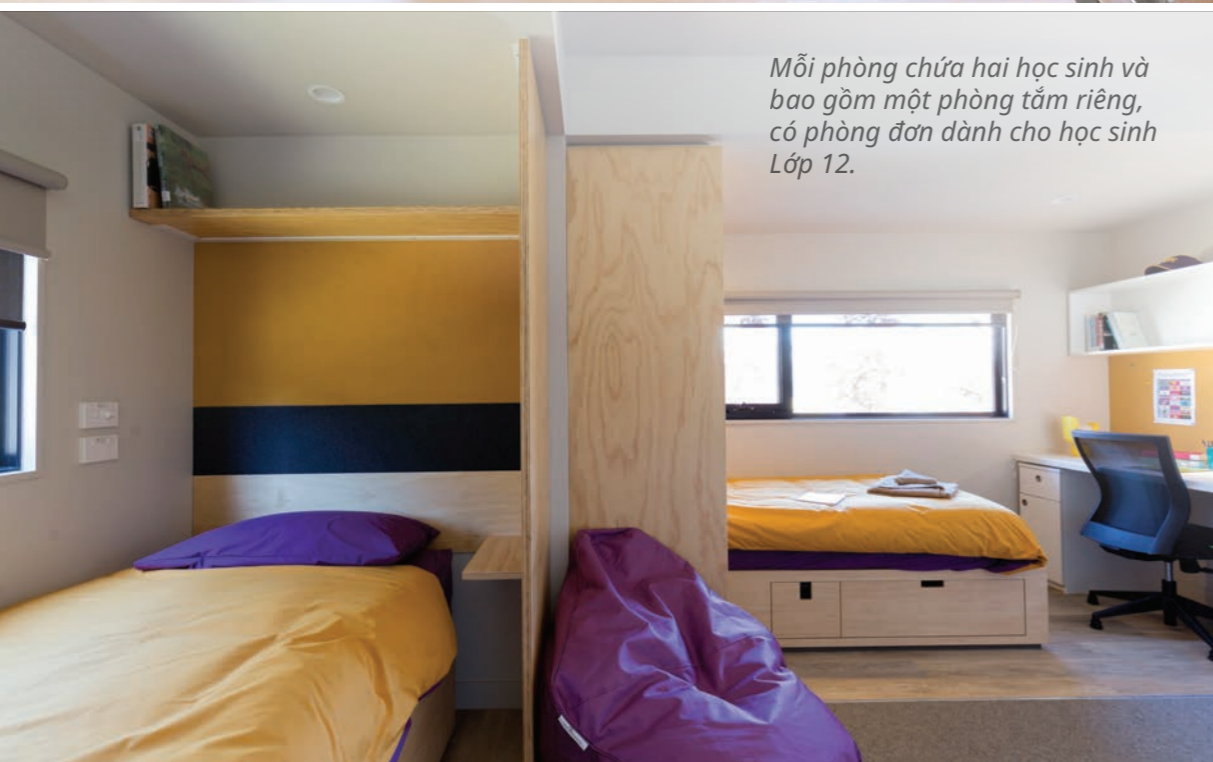
Mỗi phòng chứa hai học sinh và bao gồm một phòng tắm riêng, có phòng đơn dành cho học sinh Lớp 12.